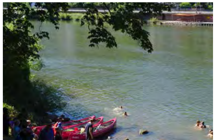
Fotos vom Strandfest 2019