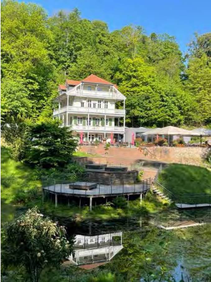
Tag des Offenen Denkmals: Wolfsbrunnen

Der Tag des offenen Denkmals macht mit dem Motto „Talent Monument“ die Bühne frei für alle Denkmal-Talente. Die Scheinwerfer richten sich auf das einzigartige Merkmal, die Denkmale auszeichnen. Dabei steht die Frage im Fokus: Was genau macht ein Denkmal zu einem Denkmal? Das berühmte Schloss, eine unscheinbare Kapelle auf dem Land, der große Betonbau der Nachkriegszeit oder das kleine Bürgerhaus von nebenan – jedes dieser Denkmale bringt Talent und Qualität mit – selbst, wenn diese nicht auf den ersten Blick erkennbar. Lassen sie sich durch das Denkmal Wolfsbrunnen führen ein Haus mit einer 500-jährigen Geschichte.