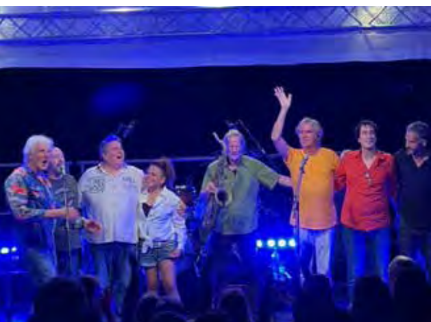
The Freddy Wonder Combo