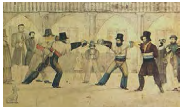
Tod den Scholaren.