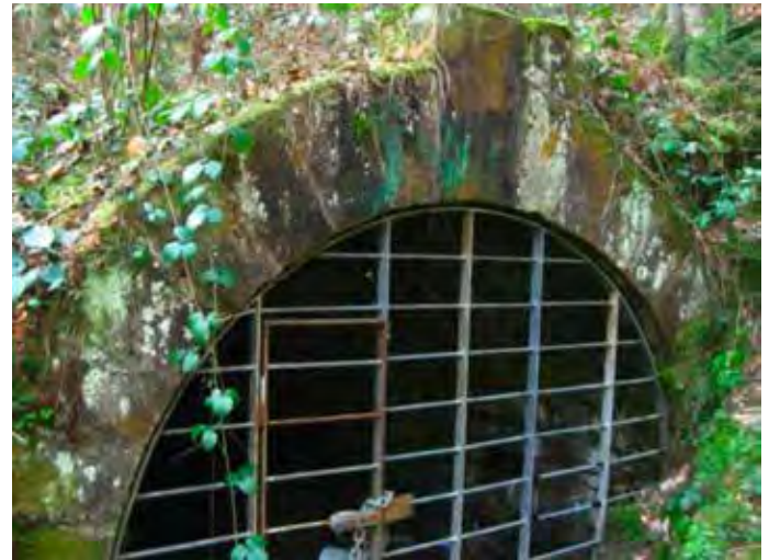
Bergbau in HD Stollen im Mausbachtal (Ziegethhausen).