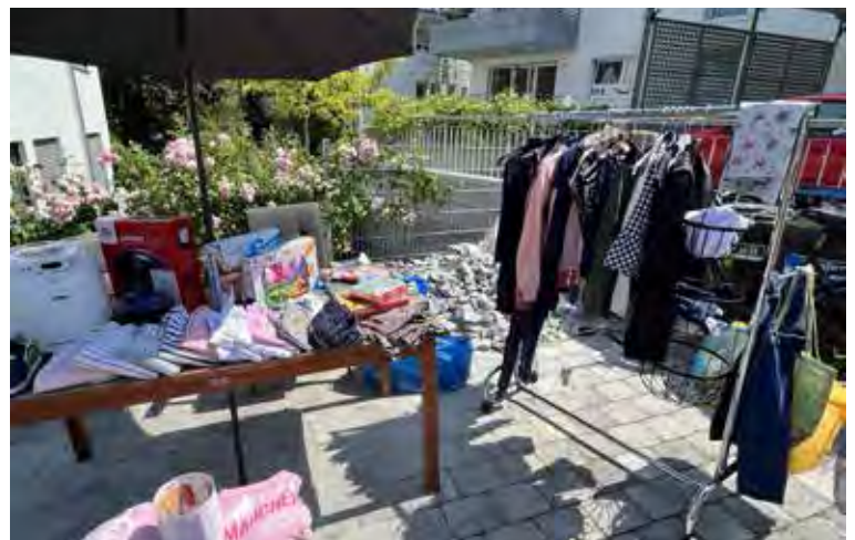
Impressionen vom 2. Nachbarschaftsflohmarkt in Schlierbach