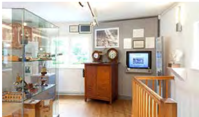
Blick in die Dauerausstellung