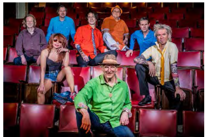
Freddy Wonder Combo

Stilsicher bedient die Freddy Wonder Combo fast alle Epochen der zeitgenössischen Musikgeschichte: da mischt sich 60's Beat mit aktuellen Charts, Highlights der 70er und 80er mit Evergreens und Jazzstandards, alles sehr individuell interpretiert.