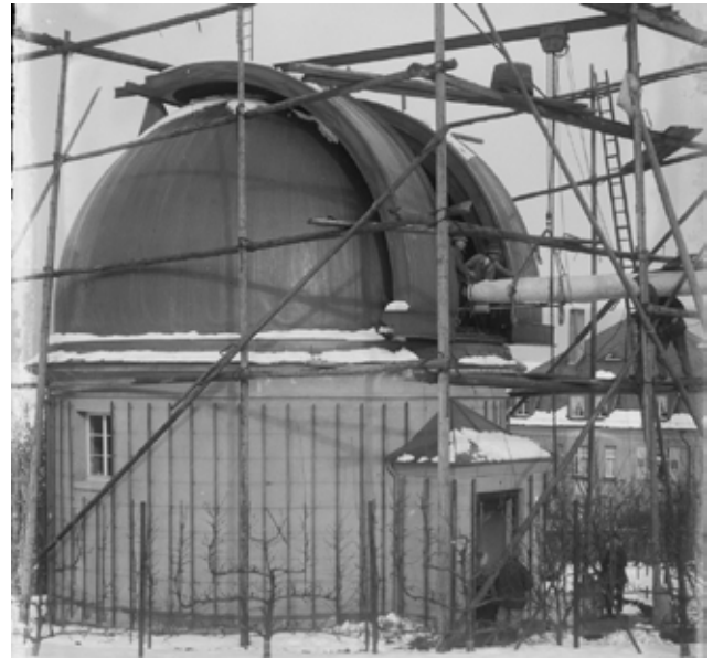
Montage des 300 mm-Fernrohrs in Carl Boschs Sternwarte, 1927

Der Sommer ist da und lockt uns alle an die frische Luft, um bei Ausflügen und Aktivitäten das frische Grün zu genießen. Auch Carl Bosch war ein naturverbundener Mensch mit vielen Interessen und Hobbys, denen er in seiner Freizeit bei Fahrradtouren und Wanderungen nachging. Unterwegs fand er fast immer etwas für seine Sammlungen. Seine Kristall-, Moos- und Insektensammlungen nahmen mit den Jahren einen solchen Umfang an, dass er für sie sogar ein eigenes Haus kaufte und einrichtete. Sein Wissensdrang beschränkte sich dabei keineswegs auf unseren Planeten. Wussten Sie, dass er auch zwei bestens ausgestattete Sternwarten neben seine Villa am Schloss-Wolfsbrunnenweg bauen ließ und Kontakte zu bedeutenden Astronomen pflegte? Carl Bosch verbrachte viele Nächte in seinem Observatorium, um den Sternenhimmel zu erforschen. Er stellte sogar einen jungen Physiker an, der in seinem Auftrag an einer Klassifikation von Fixsternen arbeitete.