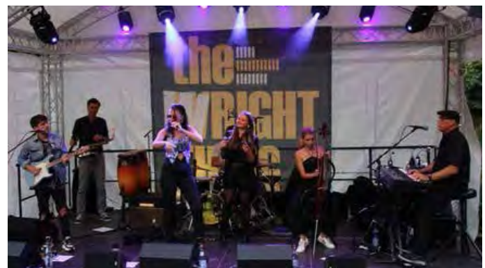
The Wright Thing