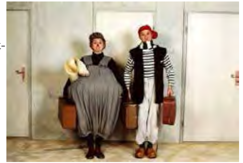
Kindertheater - Die Stromer

„Überraschung für Victorius“ ist eine turbulente Komödie für Kinder ab 3 Jahren und ihre Eltern. Mit Liebe und Witz wird die einfache Geschichte einer Freundschaft erzählt. Nicht wortreiche Dialoge und komplizierte Handlungen bestimmen die Szene, sondern Bewegung, Musik und clowneskes Spiel.